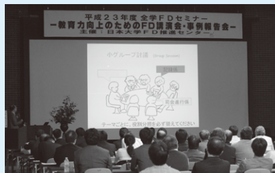
平成23(2011)年度全学FDセミナーの一コマ。