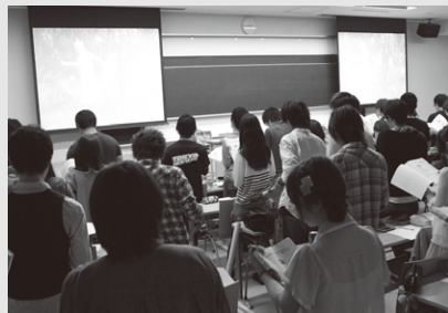
授業の様子。学生全員を起立させ、英文の音読を行う。

1年次の授業でもあるので、座席は出席番号順とし、周りの学生同士で人間関係をつくりやすくするようにしています。ちなみに、点呼中は課題作業を行わず、その成果も評価の対象としています。