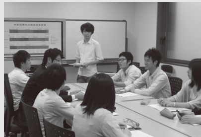
ゼミの様子。次々と出される意見に教員がコメント。

て物事を進める体験を、できるだけいろいろな人とさせたいと考えています。活動は“学生主体”で行いますが、決して“学生任せ”にはしません。学生が目標に到達するよう、一緒に走り、支え、アドバイスをするのが教員の役目です。私は学生の伴走者であるよう心掛けています。そのために、学生とは密に連絡を取って、問題点はどこかを話し、解決策を探っています。失敗と改善の積み重ねが成功を導き、達成感や自信となります。ゼミを学生一人ひとりが輝ける場にした