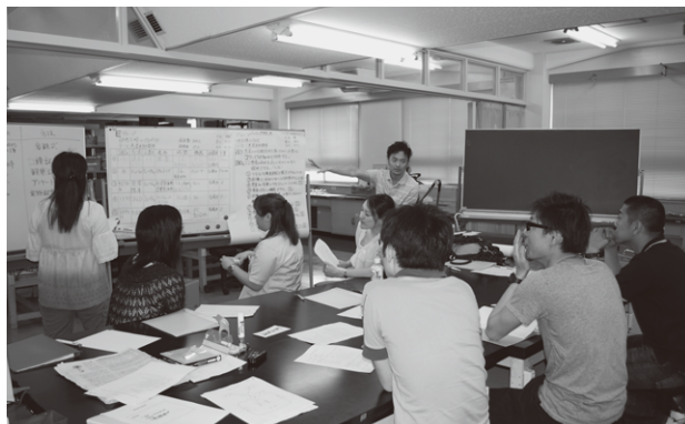
医学部における第20回教育ワークショップの様子。

WSの参加者はFDの推進者となり、また、プロダクトを現場に持ち帰り、実際のFD活動にフィードバックすることが重要です。