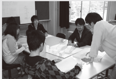
図面を確認しながら意見交換。

30人程度の少人数制授業であるため、進度が遅い学生は引け目を感じやすいようです。悩んでいる学生や連続して休んでしまう学生には、教員から声を掛けてフォローするようにしています。