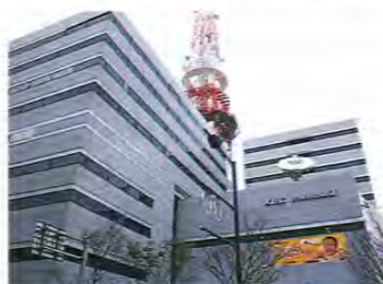
福岡市街に位置する九州朝日放送の社屋

ローカル局の局アナには、いろんな仕事があります。たとえばキー局のアナウンサーは、ニュースならニュース、バラエティの司会ならバラエティのみと、仕事の内容が決まっています。専門性が高い。でも、ローカル局のアナウンサーは、ニュースもバラエティも何でもやらなきゃいけないので、すべてのことに興味を持って取り組む必要があります。ですから、キーワードは「広く浅く」。音楽でもスポーツでも、苦手意識を持たずにオールマイティに取り組むよう指導していますね。