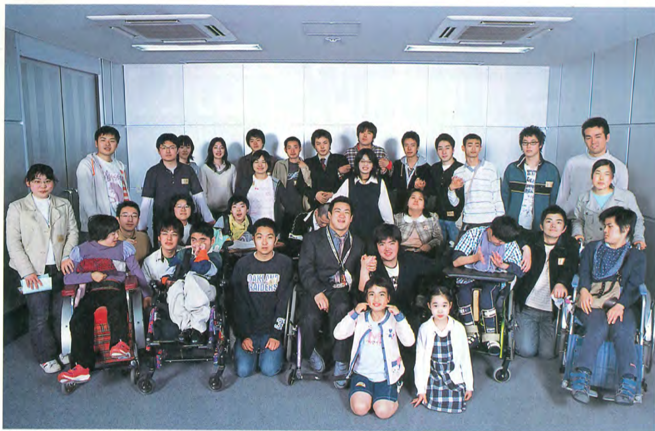
杉並区肢体不自由児者父母の会総会で介助ボランティア活動を行う学生赤十字奉仕団