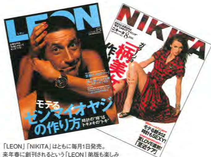
「LEON」「NIKITA」はともに毎月1日発売。来春に創刊されるという「LEON」弟版も楽しみ

——「男は中身」の時代から、ずいぶん変わったものですね。我々よりもうひとつ上のオヤジ世代、今の初老の世代は、男は質実剛健、外見ではなく中身だという考え方だと思います。でも、今の40代は中身も大事だけれど外見も気になる世代ですよ。モノを買うことによって他人と差別化するといったことにも、あまり抵抗はありません。私自身、小さい頃、友だちが持っていないようなおもちゃを親父から買ってもらって、差別化する心地よさを感じた記憶があります。そうはいつでも日本の男性はシャイですからね。おしゃれをすることに抵抗があって、そのバリアを「LEON」が吹き払ったということなんじゃないでしょうか。