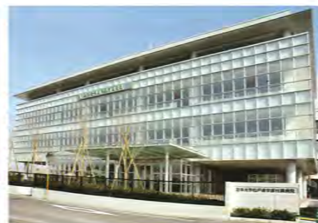
松戸歯学部の新病院棟