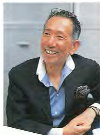
主婦と生活社 「LEON」「NIKITA」 編集長