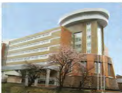
完成した70号館。工学部のシンボルとなる

他にも、生産工学部の12号館とリサーチ・センター、薬学部の新2号館がそれぞれ完成した。