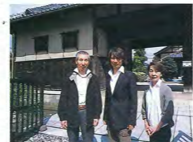
岐阜市の自宅で両親と

「本当に役者がやりたいのか、自問することもあります。でも、ここまで来たんだから簡単にはやめられない。バックアップしてくれる両親、部活動でお世話になった先生や先輩、一緒がんばっている仲間たちのためにも、しっかり成長していきたいですね」