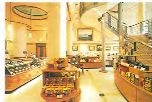
平成11年落成のふと美工場。厳しい衛生管理のもと、クオリティの高い生チョコレートをはじめ、数々の商品を発信している。工場直売店の洗練されたディスプレイが目玉。

北海道物産展では、全国の百貨店約330か所に出店しています。フェア以外では売ってませんから「どこで買えるんですか？」