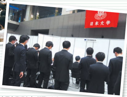
合同企業研究会・就職セミナー

自分の価値観・人生観を満たす未来実現のため、『不足しているものが何か』を理解し、学生生活を通じて人間関係形成能力・情報活用能力・将来設計能力・意思決定能力を修得していく