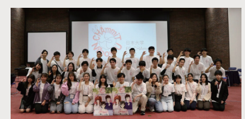
開催当日の学生スタッフの集合写真。手のポーズは、CHAmmiTの“C”を表している。

私は昨年からの活動に参加していますが、学生のFD活動の認知度はまだ低く、周知することが大きな課題です。今回は、昨年度よりも学生スタッフの交流の場を多く設けました。FDについて深く知ってもらい、学生スタッフを中心としてFD活動が多く学生の学生に浸透していけばと考えています。