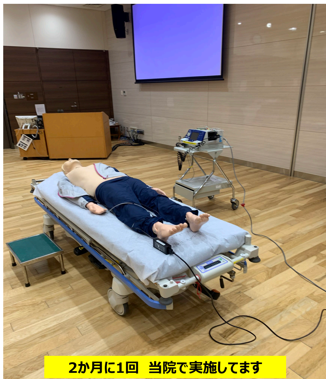
2か月に1回 当院で実施してます