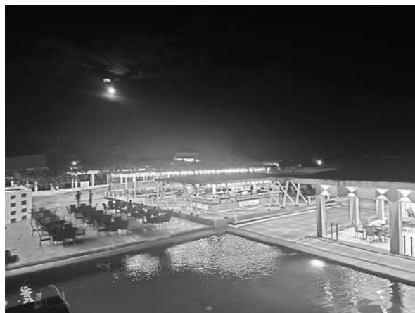
写真4 SMEAGベイドリーム3校：野外レストラン (2023年3月10日)