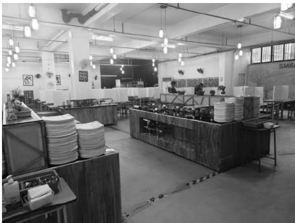
写真3 SMEAGセブ校：カフェテリア (2023年3月9日)