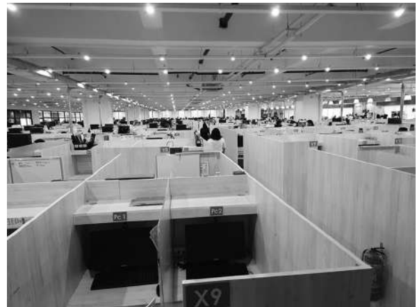
写真8 QQ English ITパーク校：授業用ブース (2023年3月1日)

授業を受ける個別ブースは400以上あり、そこで留学生に対する対面授業を実施するほか、世界中に向けてオンライン授業を配信する用途にも使用されている。パンデミック後の時期であったため、対面の留学生は200名程度とのことだが、コロナ以前はブースが埋まるほどの生徒数があったとのことである。留学生の割合は、日本企業のためであろうか日本人の割合が高い。ただ、他のフィリピンの語学学校と同様にマンツーマン授業のため、英語を話す時間は非常に多く確保できる。一方で、時代の変化に伴い、学生のスタイル・ニーズに合わせて個別に授業内容や時間割を選択できるカリキュラムとオンライン授業を併用することで帰国前後においても継続した内容を受講できるスタイルといった先行研究では説明されていない新たな知見も確認することができた。このようにセブの語学学校も近年多様化が進んでいることが確認できた。