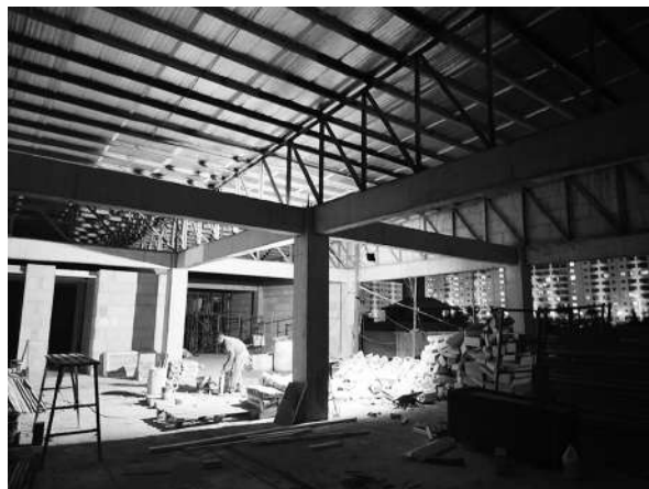
写真5 SMEAGベイドリーム3校：校舎建築中の様子 (2023年3月10日)