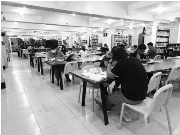
写真10 セブシティ図書館の様子 (2023年2月24日)

現地英語の特徴に、母語がどのように影響しているかを知るために、まずは母語(セブアノ)の言語を検証する必要があった。セブアノについての文法書を探すため、セブシティ図書館を訪問した。そこで僅かな現地語の資料を閲覧することができた。しかし、セブアノ自体の体系的な文法書は見つけることができなかった。これは、母語の教育が十分でなかったことに起因している可能性はあるが、ヒアリングの結果から、フィリピンにおいては、近年母語教育の重要性の見直しがなされており、母語を扱う授業が展開されているとのことであった。今後、文法に関する教育資料を取集する予定である。