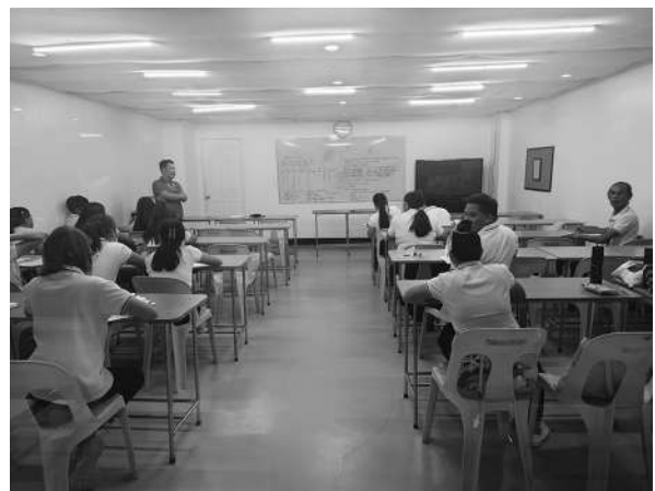
写真1 SMEAGセブ校：講師研修の様子 (2023年3月9日)

ム・施設等の案内を受けた。立地は、セブの行政機関が集まる中心地から近く、大規模ショッピングモールであるアヤラ・センター・セブも移動圏内となっている。訪問当時は、250名程度の学生が在籍しており、おおよその国籍分布は日本40%、韓国20%、中国15%、台湾5%、ベトナム5%、その他15%ということであった。カリキュラムとしては、セブの主流のスパルタスタイルで、早朝から夜まで、マンツーマンを中心とした(科目によっては少人数のグループワーク)授業が実施され、受講生個人の目標を達成する形で展開されていた。なお、目標到達度の測定については、主としてケンブリッジ英語検定が使用されていた。見学した授業では、アカデミックライティングが行われていたが、受講生・教師ともかなりの予習量があることが伺い知れ、添削においても複数のパターンが提示され、またその用法に関するディスカッションも高いレベルにて実施されていたのが印象的であった。