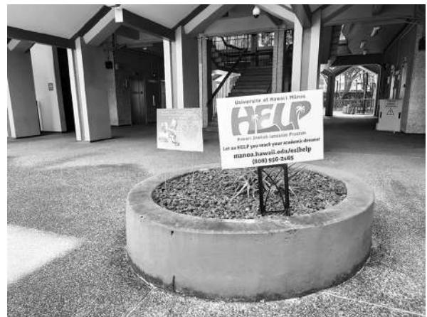
写真11 ハワイ大学マノア校：語学学校HELP (2023年3月16日)

ハワイにおいても、セブと同様の観点から施設を訪問した。まず、ハワイ大学マノア校及びその付属語学学校プログラムHawaii English Language Program (HELP) の施設を見学し、施設や留学生の様子の確認をおこなった。セブにおいては、マンツーマンが特色だが、こちらは少人数グループワークを中心としたカリキュラムであった。留学生の年齢層については社会人が少ないように見受けられ、セブとの相違が認められた。