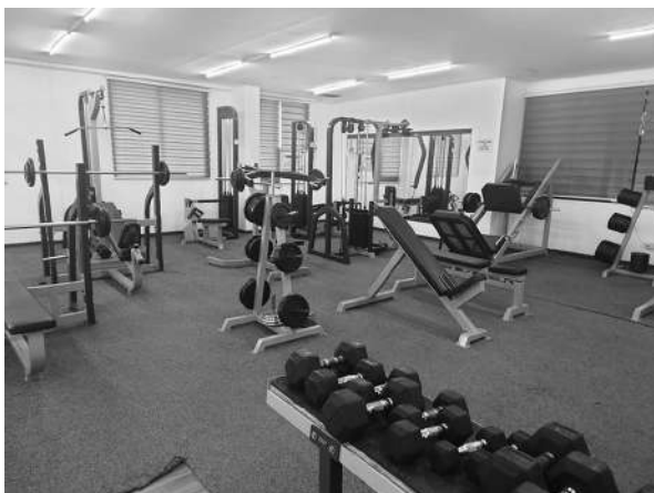
写真2 SMEAGセブ校：トレーニングルーム (2023年3月9日)

SMEAG ベイドリーム3校はセブ校と同様にSMEAGの校舎の一つである。この校舎は、授業教室・宿泊施設の建物が現在建築中である。完成すると300人規模の留学生を収容できる予定である。先述したセブ校との棲み分けとして、この校舎はビジネス英語を中心に展開し、社会人や家族連れを生徒として想定しているとのことであった。関連施設として、レストラン部分は完成しており、訪問時においては一般に開放されていた。将来的には、広大な敷地内にマーケットなどの一般施設を設置し、また、ビーチにある船を用いて、セブで人気のアクティビティ等の業務も実施するといった、学校一帯を一つの街として完成することが想定されていた。