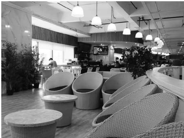
写真7 QQ English ITパーク校：併設ラウンジスペース (2023年3月1日)