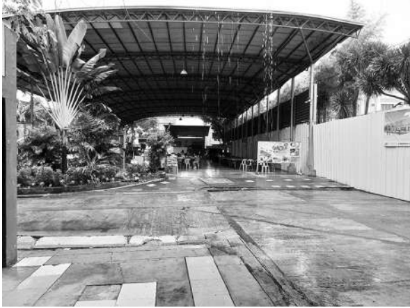
写真9 サン・カルロス大学校舎内 (2023年2月27日)

現地英語の特徴に、母語がどのように影響しているかを知るために、まずは母語(セブアノ)の言語を検証する必要があった。セブアノについての文法書を探すため、セブシティ図書館を訪問した。そこで僅かな現地語の資料を閲覧することができた。しかし、セブアノ自体の体系的な文法書は見つけることができなかった。これは、母語の教育が十分でなかったことに起因している可能性はあるが、ヒアリングの結果から、フィリピンにおいては、近年母語教育の重要性の見直しがなされており、母語を扱う授業が展開されているとのことであった。今後、文法に関する教育資料を取集する予定である。