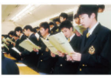
研修会を終了した。1クラス428人の大きな活躍が期待されている。写真。

4月23日から2泊3日で、1年生を対象に中高一貫教育の基本的構想を理解させ、学級づくりや基本の習慣を体得させることを目的に、日本大学軽井沢研修所を使い実施された。生徒たちは、「千曲川旅情のうた」（島崎藤村作）の暗唱大会で大いに盛り上がり、校慶祭の合唱発表曲の練習を通してクラスの団結力を高めた。また懐古園・勇輝出し・白糸の滝などを見学し、郷土の歴史や自然の驚異を学び帰途に着いた。