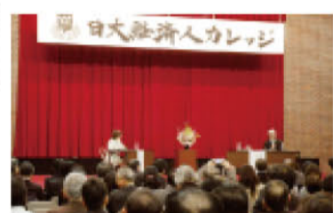
「上」日大経済人カレッジで特別講演を行う演出家のテリー伊藤さん（右）。会場は大勢の人で埋まった。

「一人の人間が一国を引張って行くのは難しい。自分の欠点を知り、自分ができる部分は素直に助けを求めよう」との意見を述べた。